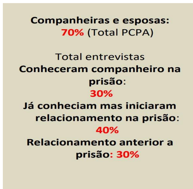
Imagem 1: Perfil das visitantes em presídios no Brasil

A seguir, um quadro sinóptico do percentual do perfil dessas visitas: