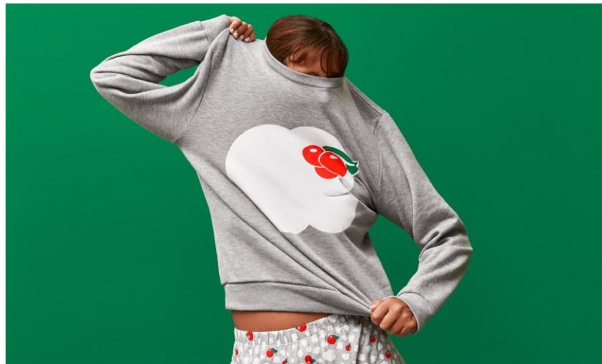
Imagem 04: linha de roupas da campanha