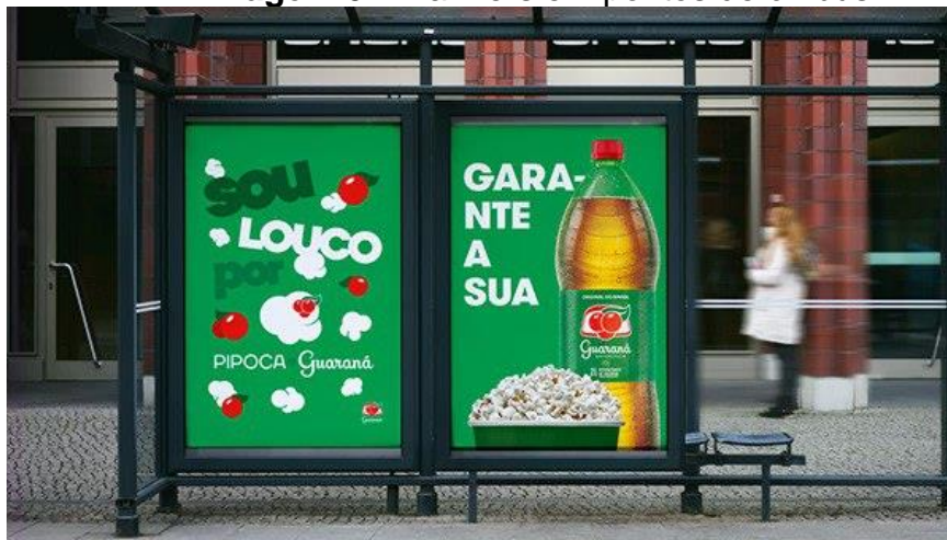
Imagem 04: Banners em pontos de ônibus

Além disso, há também um trabalho nas mídias de apoio, tanto no impresso quanto no digital. Banners instalados em pontos de ônibus apostaram na estética completamente nostálgica, preservando o conteúdo de sucesso, mas com a utilização de uma tipografia mais moderna, que dialoga com todos os públicos almejados. Com títulos diretos e uso simples das imagens, manteve-se o uso de ícones de pipoca e guaraná que aparecem no vídeo para TV e nas redes sociais.