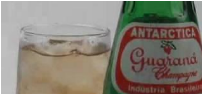
Imagem 01: Comercial “Pipoca e Guaraná”

Com o objetivo de alavancar suas vendas, lançou, nos anos noventa, a campanha “Pipoca e Guaraná”. A temática alcançou notoriedade, como um case de sucesso da empresa, considerada um dos maiores clássicos da publicidade brasileira. Seu jingle foi extremamente popular e faz parte da cultura popular do País.