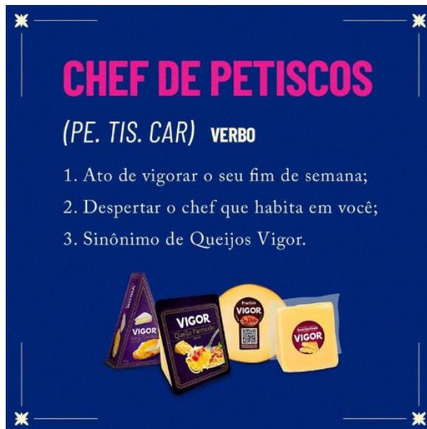
Imagem 5: anúncio digital do dos queijos da Vigor