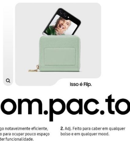
Imagem 6: anúncio do celular Flip