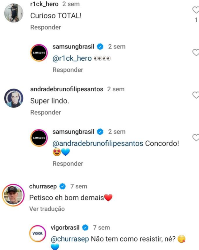
Imagem 7: comentário sobre o anúncio dos queijos da Vigor