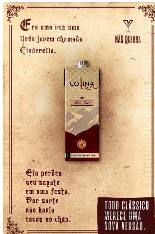
Imagens 3: campanha da Cooperativa Agroindustrial Nova Aliança