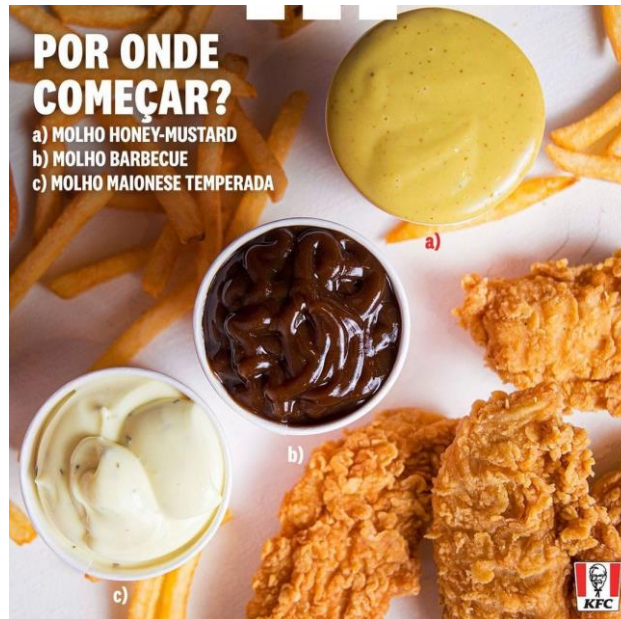
Imagem 7: anúncio dos molhos da KFC