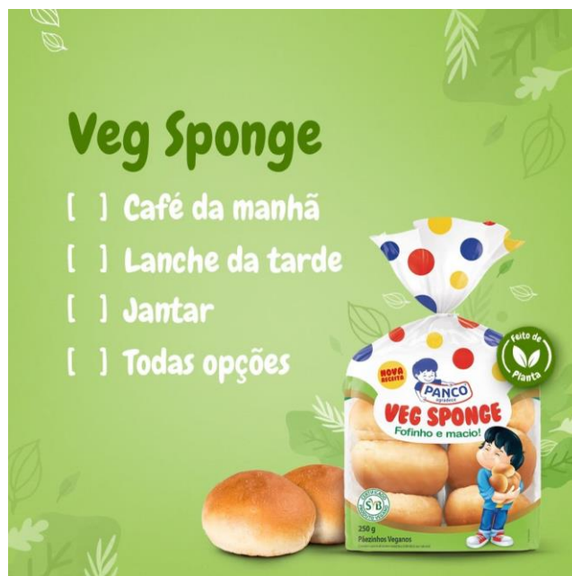
Imagem 8: anúncio do pão da Panco