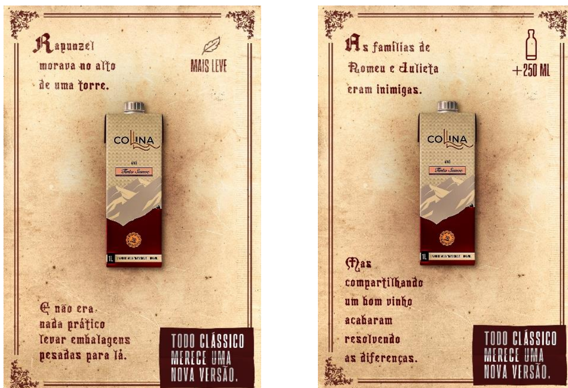
Imagens 1/2: campanha da Cooperativa Agroindustrial Nova Aliança

Para divulgá-la, foi realizada uma campanha publicitária que traz contos clássicos da literatura em uma breve história adaptada para a inclusão do produto anunciado. A proposta é associar a mudança da tradicional embalagem à alteração de histórias clássicas.