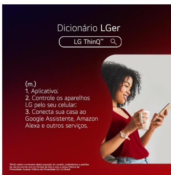
Imagem 4: anúncio digital do dicionário LGer

Nas análises a seguir, temos três anúncios publicados no Instagram. Eles apresentam o mesmo gênero textual: o verbete. Definem, portanto, itens lexicais, dando atributos peculiares a um determinado produto, marca ou serviço. Nas imagens 4, 5 e 6, apresentam-se as características e qualidades do Dicionário LGer, dos produtos Vigor e do celular da Samsung, respectivamente: